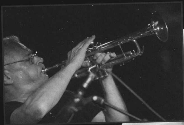
Af Jørgen Nielsen